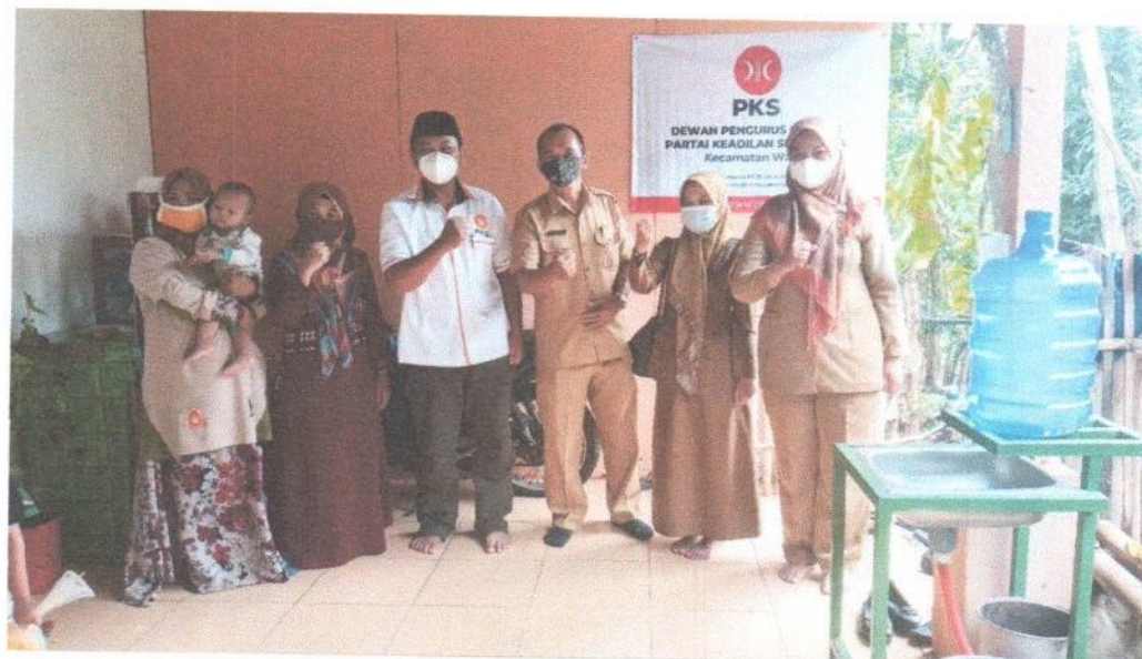
TIM VI : DPC PKS KEC. WADO