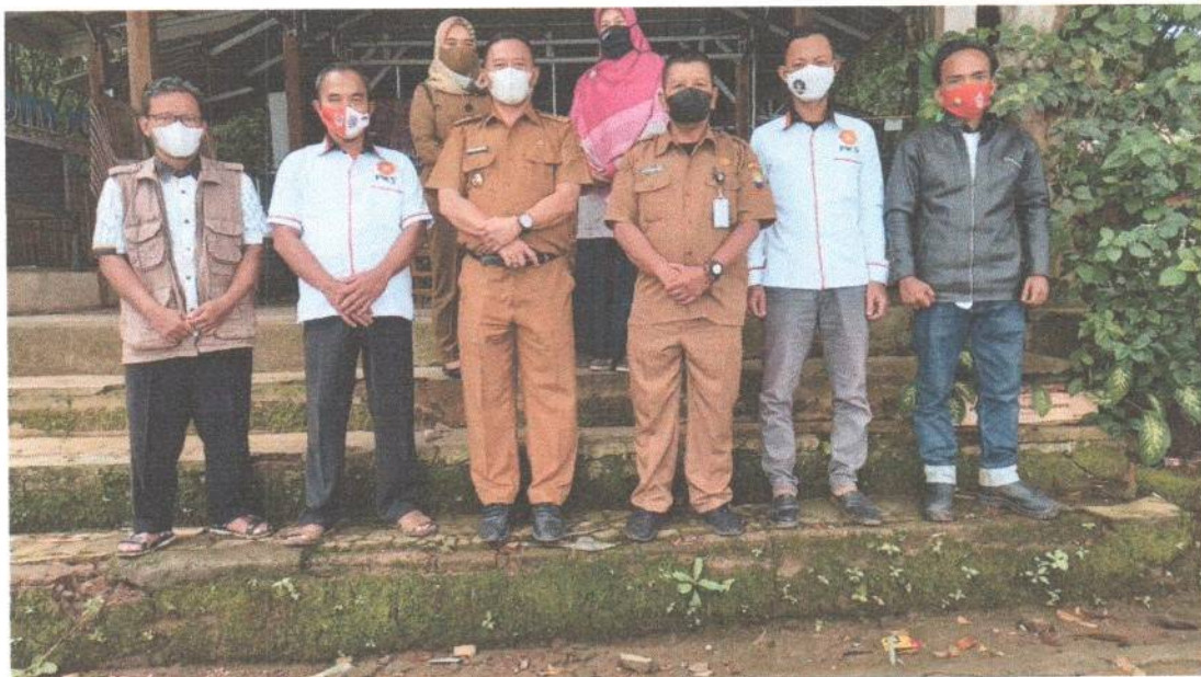
TIM I : DPC PKS KEC. DARMARAJA