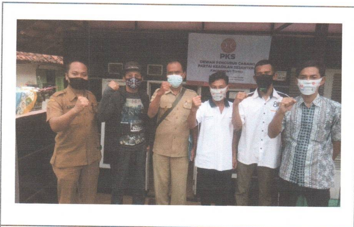
TIM VII : DPC PKS KEC. TOMO